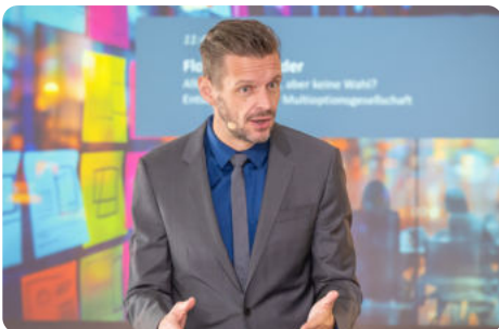
Florian Schroeder, Kabarettist und Philosoph

Florian Schroeder , Kabarettist und Philosoph, brachte das Thema Entscheidungskultur in der Multioptionsgesellschaft pointiert und klug auf den Punkt. Unter dem Titel „Alle Möglichkeiten, aber keine Wahl?“ regte er mit Humor und Tiefgang zur Selbstreflexion an: Was braucht es für klare Entscheidungen in komplexen Zeiten?