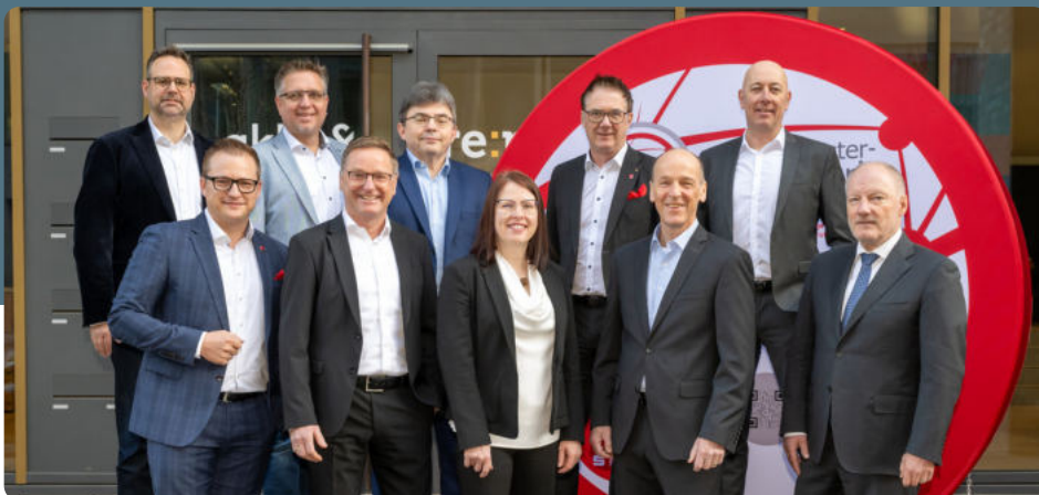
Geschäftsführerin und Geschäftsführer der Partner des S-Dienstleister-Netzwerks

Ob strategische Erfolgsfaktoren, methodische Hilfen für den Führungsalltag oder der persönliche Austausch im exklusiven Kreis – die Fachtagung war Plattform, Impulsgeber und Netzwerk zugleich.